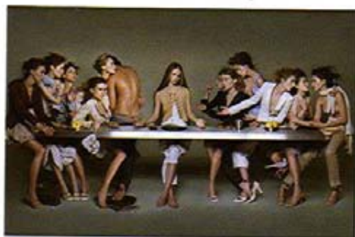
Abendmahlmotiv für Girbaud der italienischen Fotografen Niedermair

weiblichen Modells an Stelle von Jesus und den Jüngern. Am 10.03.2005 entschied ein Gericht zu Gunsten der Kirche und untersagte die Verwendung des Motivs.