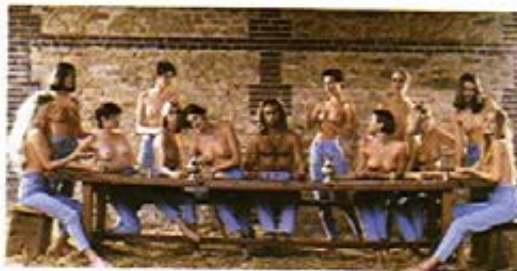
Das Abendmahl – Werbeanzeige 1993 von Otto Kern Ursprungsaufnahme – Anzeige wurde zurückgezogen.

Wegen öffentlicher Empörung wurde 1993 das Abendmahl-Werbefoto von Horst Wackerbart/Otto Kern zurückgezogen und erst abgewandelt wieder veröffentlicht. Einen Prozess gab es hierzu aber – soweit bekannt – in Deutschland nicht.